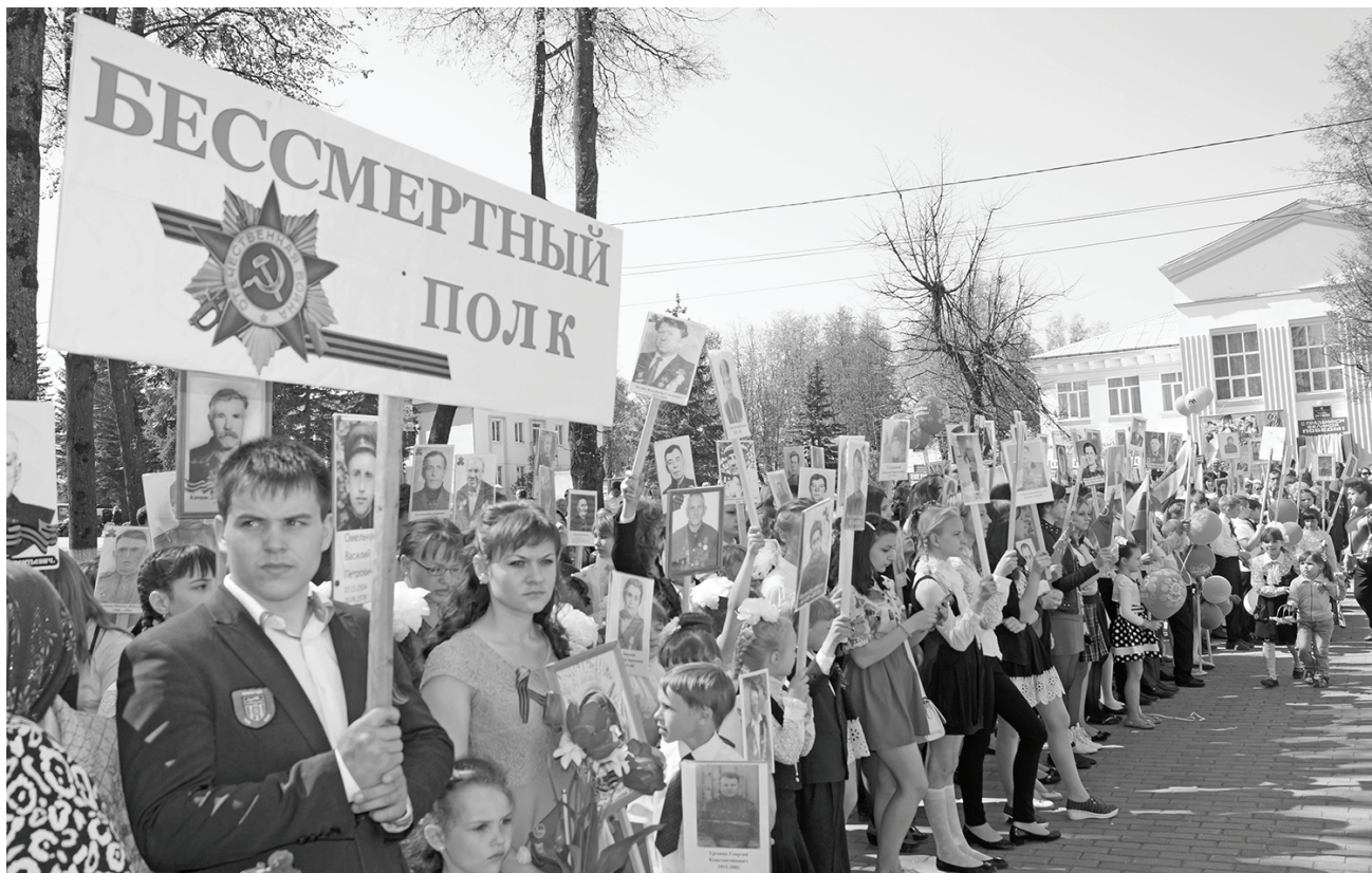
Думиничи. «Бессмертный полк». Присоединяйтесь!