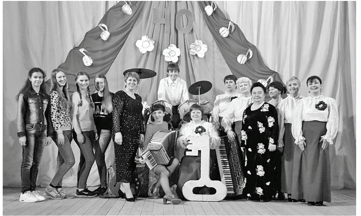
Участники праздника, посвященного юбилею Дома культуры.

Новослободский Дом культуры отметил свое 40-летие.