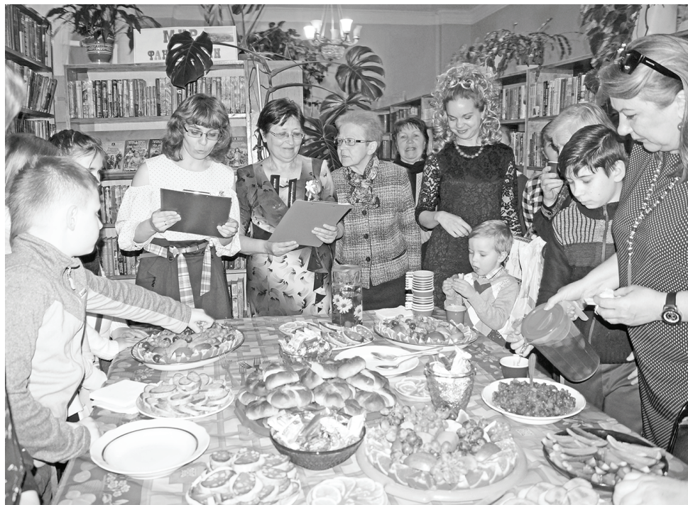
Вкусные и экологически чистые продукты в фитобаре Думиничской районной библиотеки очень понравились всем гостям.